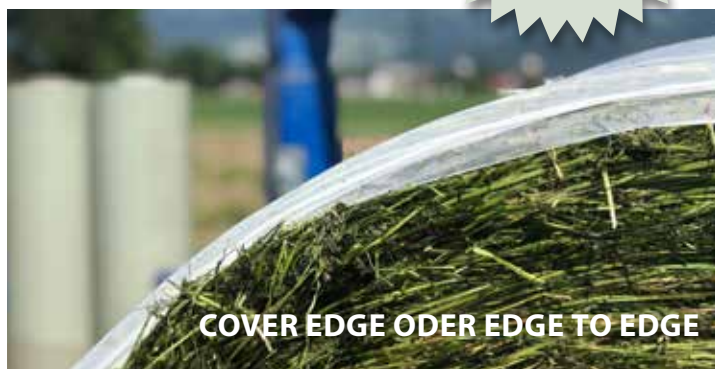
COVER EDGE ODER EDGE TO EDGE